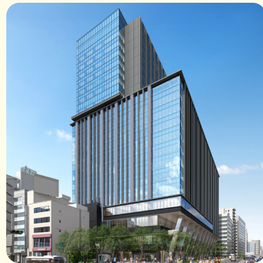
▲本社が入居しているビル

私たちは、いくつかのちがう材料を組み合わせ、それぞれの特徴を生かした新しい材料を作る、「コンポジット技術」を使ったものづくりをしています。たとえば、自動車のエンジンで使われるゴムの部品、ゴルフクラブの部分(シャフト)、救命用のボートなどがあります。ほかにも工場にある大きな機械の部品、医療器具などにも、私たちのものづくりが関わっています。目には見えにくいけれど、人やまちの安心を支える会社です。