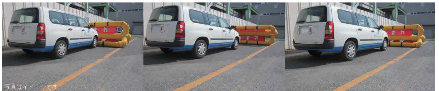
3足型にすることで転倒回転しても常に抑止機能を維持可能。重厚感と安定性があり高い抑止効果とインパクトを発揮します。