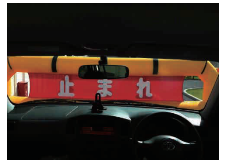
車内からの視認性に優れております。