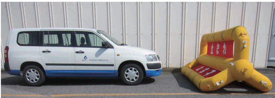
普通車との大きさ比較。抑止力の発揮に十分な大きさを有しております。